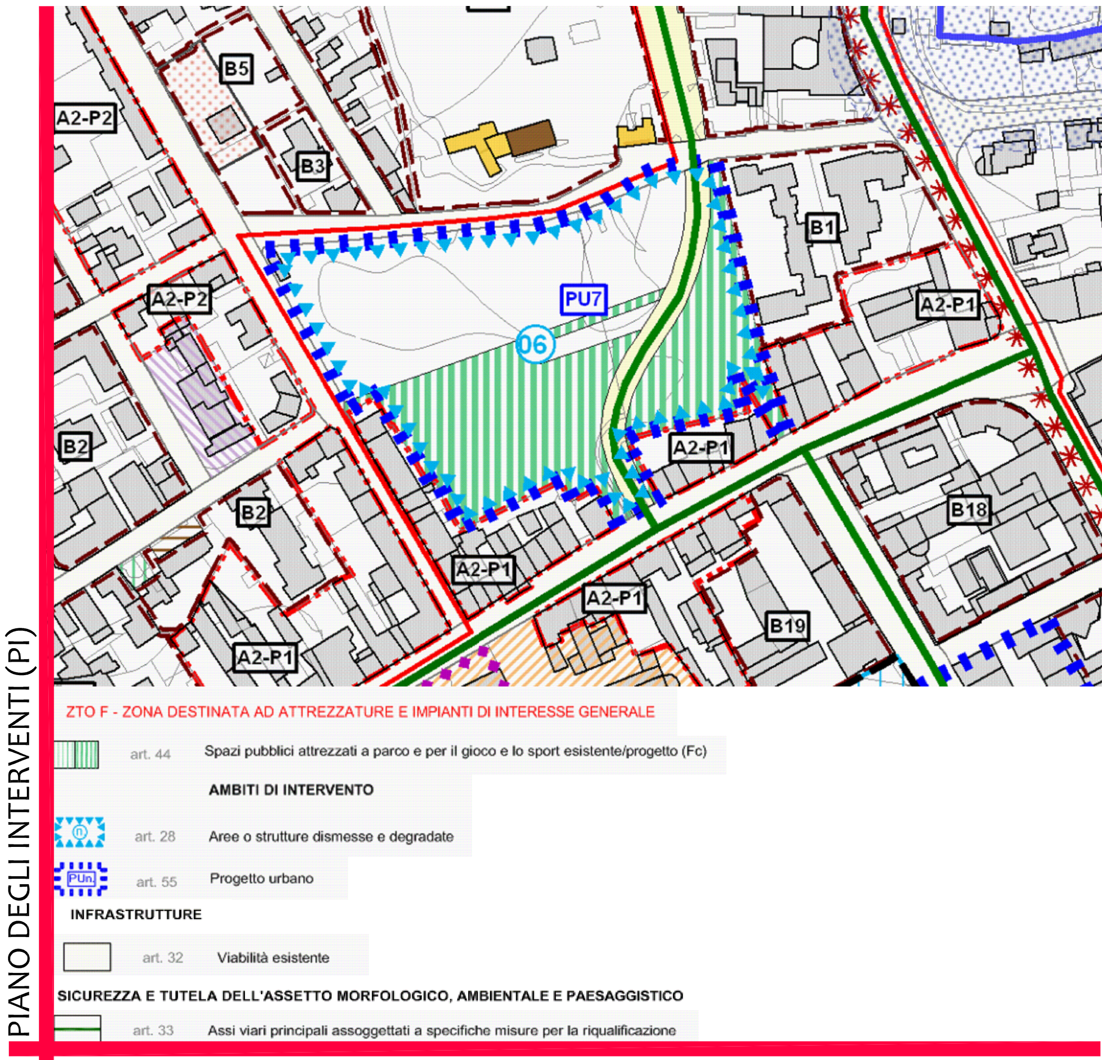
Elaborato 3 - Zonizzazione